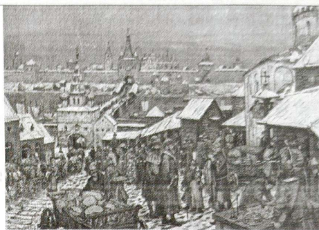
4. А.М. Васнецов «Новгородский торг»