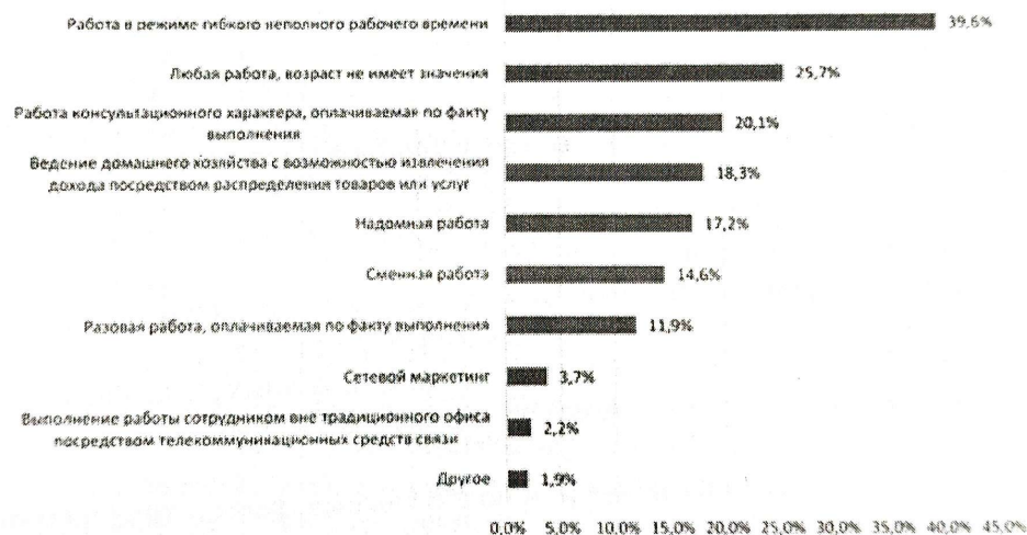
Рис. 2. Наиболее подходящая работа для пожилых людей, по мнению работодателей (в % от числа опрошенных, N – число опрошенных, N = 268)

Основа для текста и источник статистических данных – Щанина Е.В. «Практики поведения пожилых людей, направленные на повышение своего благосостояния в своевременном российском обществе». Мониторинг общественного мнения: экономические и социальные перемены, 2, 2021, с. 138–161.