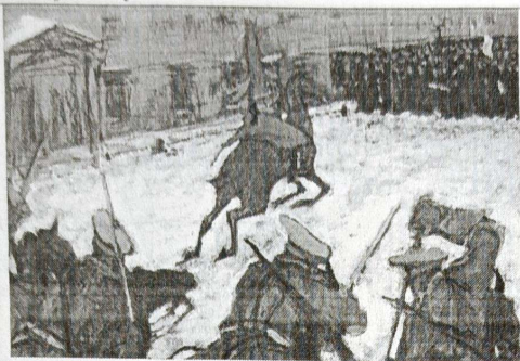
3. В.А. Серов «Солдатушки, бравы ребятушки! Где же ваша слава?»