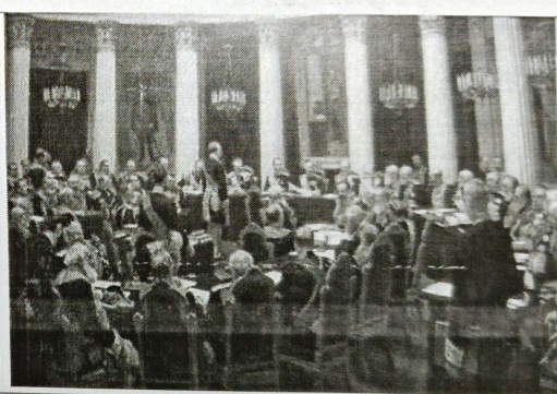
6. И.Е. Репин «Торжественное заседание Государственного совета»