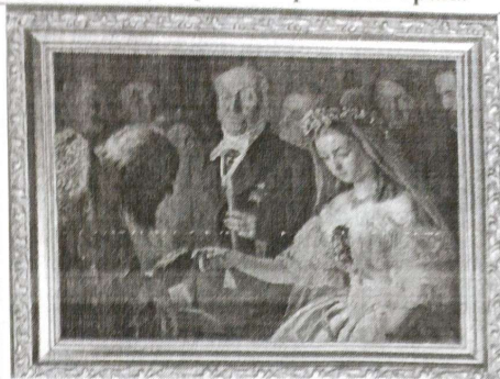
2. В.В. Пукирев «Неравный брак»