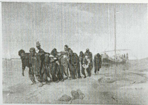
5. И.Е. Репин «Бурлаки на Волге»