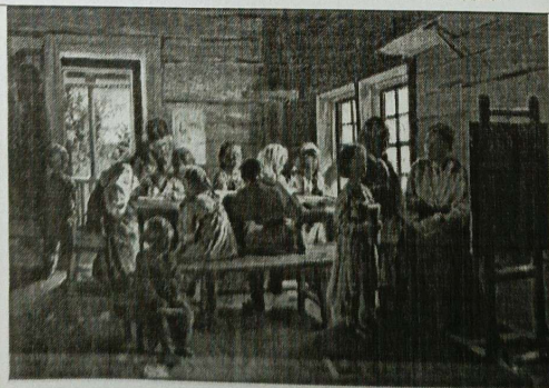
7. В. Маковский «В сельской школе»