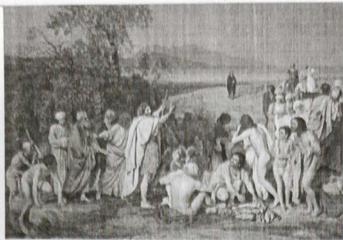
1. А.А. Иванов «Явление Христа народу»